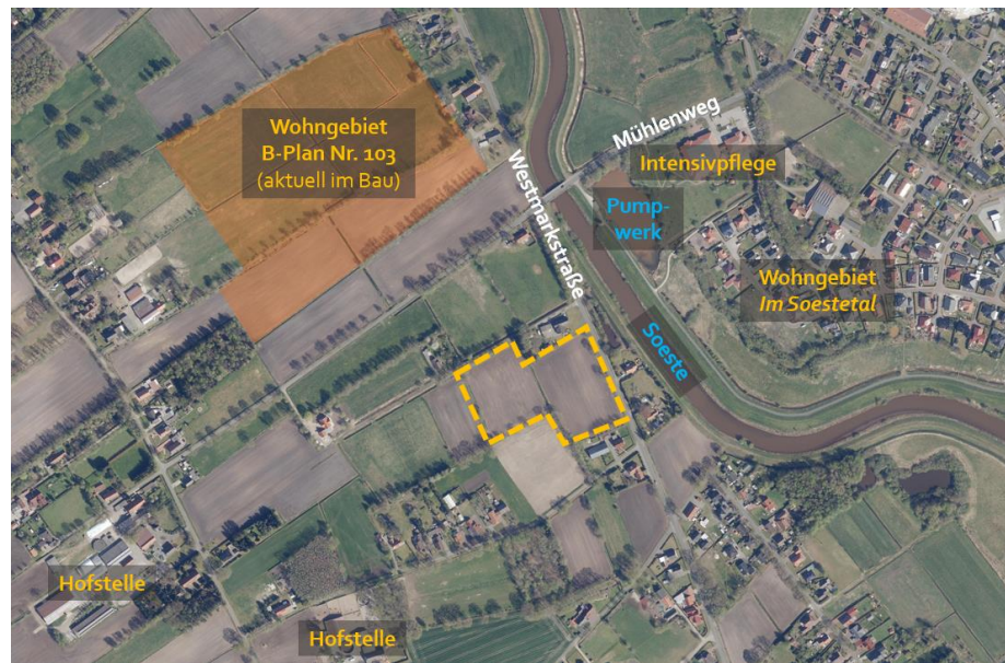
Abb. 4 Übersicht über die umliegenden Nutzungen