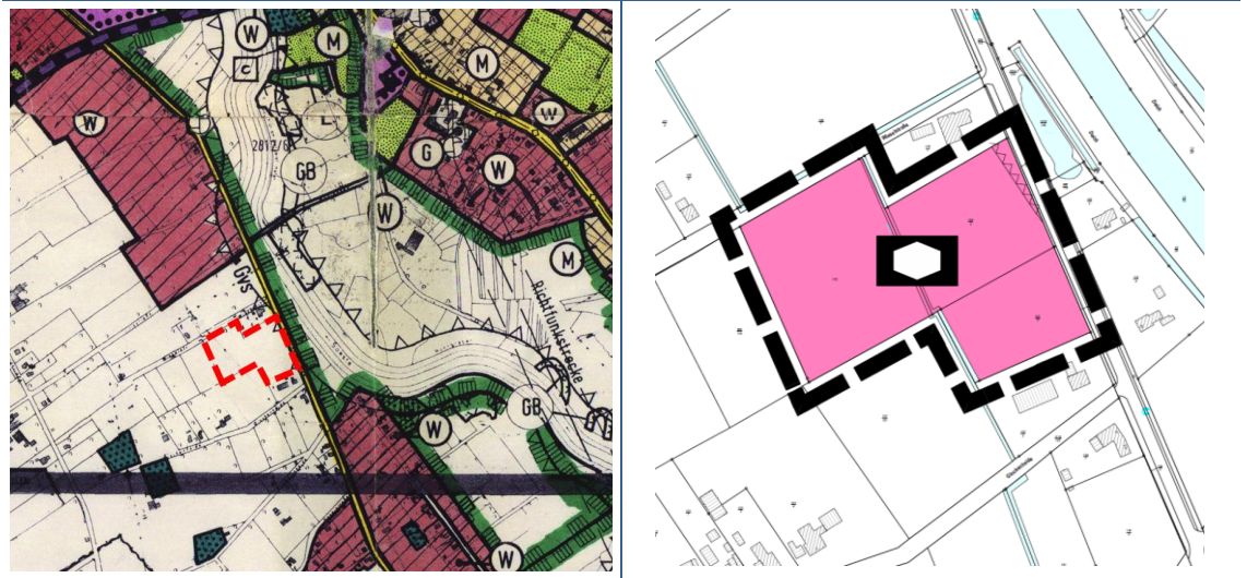
Abb. 3 Auszug aus dem gültigen Flächennutzungsplan der Gemeinde Barbel und der geplanten 48. Änderung

Der Flächennutzungsplan (FNP) der Gemeinde Barbel stellt das Plangebiet derzeit als landwirtschaftliche Fläche dar. Die Flächen östlich der Westmarkstraße sind großräumig als Gebiet mit besonderer Bedeutung für Natur und Landschaft gem. RROP Landkreis Cloppenburg dargestellt. Die Deichschutzzone des Soestedeichs berührt den äußersten Rand des Änderungsbereichs.