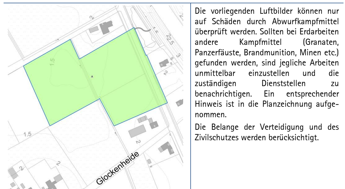
Abb. 6 Luftbildauswertung durch den Kampfmittelräumdienst –grün: kein Handlungsbedarf

Mit Schreiben vom 06.12.2022 teilt das Landesamt für Geoinformation und Landentwicklung Niedersachsen (LGLN)-Kampfmittel mit, dass die für das Plangebiet vorhandenen Luftbilder auf Antrag der Gemeinde hin ausgewertet wurden. Nach durchgeführter Luftbildauswertung wird keine Kampfmittelbelastung des Plangebiets vermutet.