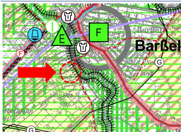
Abb. 2 Darstellung des Plangebiets im Regionalen Raumordnungsprogramms

Das Regionale Raumordnungsprogramm (RRÖP) des Landkreises Cloppenburg 2 weist die Gemeinde Barbel als Grundzentrum mit der besonderen Entwicklungsaufgabe Fremdenverkehr und als regional bedeutsamer Erholungsschwerpunkt aus.