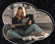
Filiz-Sofie deutsche „Evergreens“