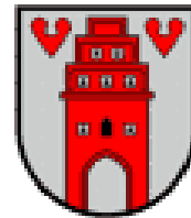
Stadt Friesoythe Der Bürgermeister