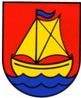
Gemeinde Barßel Der Bürgermeister